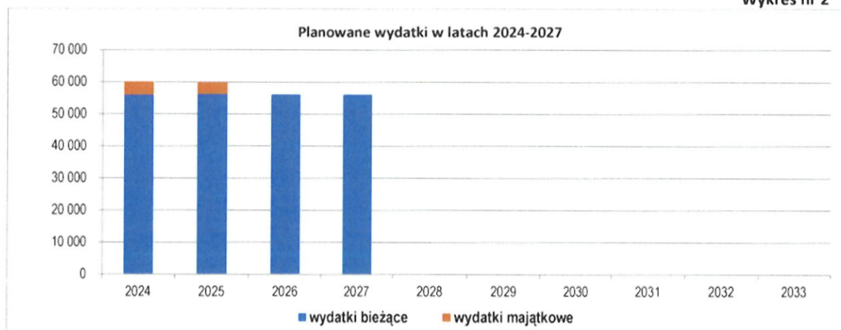
Wykres nr 2

W Wieloletniej Prognozie Finansowej objętej prognozą lat 2024-2027 zostały zaplanowane wydatki ogółem, w szczególności w latach 2024-2025 w podziale na wydatki bieżące i wydatki majątkowe.