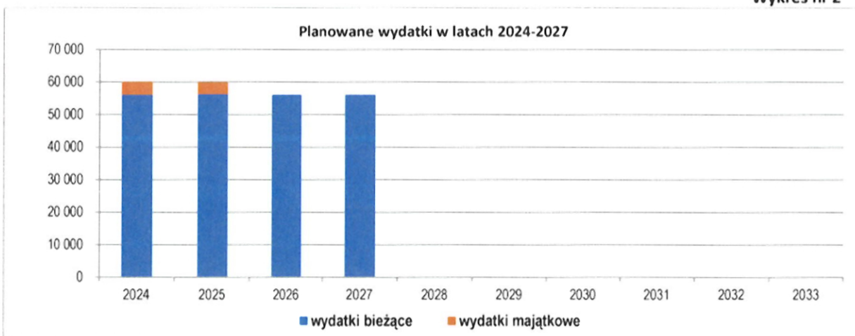
Wykres nr 2

W Wieloletniej Prognozie Finansowej objętej prognozą lat 2024-2027 zostały zaplanowane wydatki ogółem, w szczególności w latach 2024-2025 w podziale na wydatki bieżące i wydatki majątkowe.