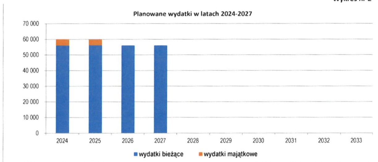
Wykres nr 2

W Wieloletniej Prognozie Finansowej objętej prognozą lat 2024-2027 zostały zaplanowane wydatki ogółem, w szczególności w latach 2024-2025 w podziale na wydatki bieżące i wydatki majątkowe.